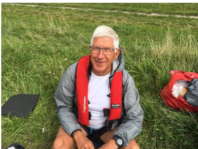
Foto af forfatteren, taget af Vagn, efter grundig instruktion og mange forsøg.

På satellit-billedet på næste side kan man se ruten med Roskilde havn nederst til højre (SE) i farvandet og Møllekrogen øverst til venstre (NE)